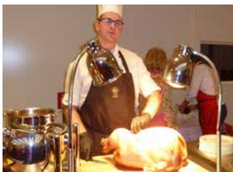
Höhepunkt des Nachmittags ist der Anschnitt des traditionellen Truthahnbratens.

Am 27. November lädt der Deutsch-Amerikanischen Frauenclub von 11 bis 17 Uhr zum 66. Charity Bazaar in den Großen Festsaal des Hotel Grand Elysée (Rothenbaumchaussee 10) ein. Mit dem Erlös unterstützen Hamburgs Wohltätigkeitspionierinnen Spielhäuser, fördern der deutsch-