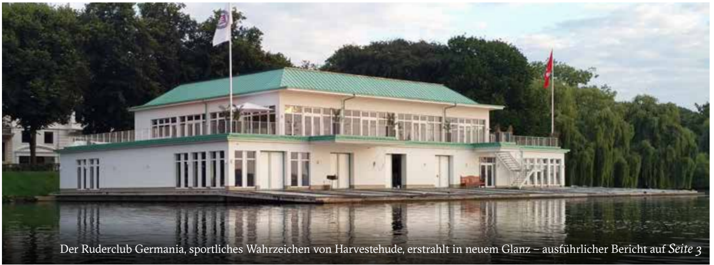
Der Ruderclub Germania, sportliches Wahrzeichen von Harvestehude, erstrahlt in neuem Glanz – ausführlicher Bericht auf Seite 3

Nachrichtenblatt des Bürgervereins vor dem Dammtor Pöseldorf r. V. Hamburg, Harvestehude/Rotherbaum