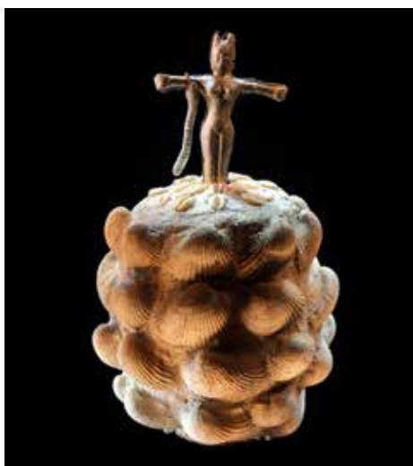
Die Geister von Olukun

Am 3. Oktober 2016 fand auf der Köhlbrandbrücke ein Brückenlauf statt, der das Überbrücken der Zeiten am Tag der Deutschen Einheit symbolisieren soll. Der Veranstalter, die Marathon Hamburg Veranstaltungs GmbH sowie die Europäische Union-Lateinamerika-Karibik-Stiftung und zahlreiche Konsulate, unterstützen mit dem „Bridge EU-LAC/Puente EU-LAC2016 – Für Ecuador“ Spendenlauf ein Sozialprojekt in Ecuador, das im April von einem schweren Erdbeben