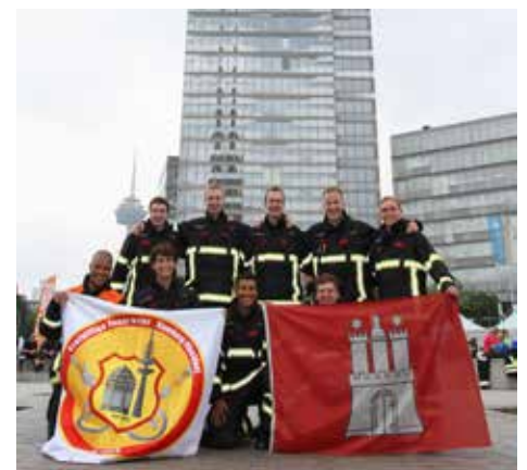
Geschafft – 4. KölnTurm Treppenlauf

Stufen bzw. 39 Stockwerke waren jetzt unser einziges Ziel. Mit vollem Fokus auf jede Treppe ließen wir ein Stockwerk nach dem anderen hinter uns. Nach knappen 8 Minuten oben ange-