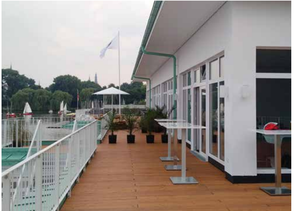
Die weitläufige Terrasse mit traumhaften Blick über die Alster lädt zum Verweilen ein

Das imposante, ursprünglich gelbe und jetzt weiße Vereinshaus des "Hamburger und Germania Ruderclubs an der Alster" fiel jedem Besucher, der an der Alster spazieren ging, sofort ins Auge. In prominenter Lage befindet sich Deutschlands ältester Ruderclub (und Zweitältester der Welt nach dem britischen Leander Club), der sein markantes Gebäude (schweren Herzens / nicht ohne Wehmut) abreißen musste. Die über 100 Jahre alten Holzpfähle, auf denen das Gebäude stand, sind über die Jahre morsch geworden, haben sich sogar zum Teil aufgelöst, so dass das Clubhaus stellenweise über den Stümpfen schwebte und die Statik gefährdete. Das Dilemma kam 2012 zum Vorschein, als man für einen geplanten Anbau einen Taucher in die Alster hinabsteigen ließ. Eine Sanierung der Pfähle mit dem darüber befindlichen Gebäude wäre sehr kompliziert und teuer geworden. Für kurze Zeit stand der Traditionsverein, der Weltmeister und Olympiasieger hervor brachte, vor ungewisser Zukunft. Eine befürchtete Auflösung oder Fusionierung des Clubs konnte glücklicherweise abgewendet werden. Spenden, Sonderumlagen der Mitglieder und die Bürgschaft der Stadt Hamburg sicherten eine längerfristige Finanzierung. Hamburg, als ein Hauptinvestor, machte aller-