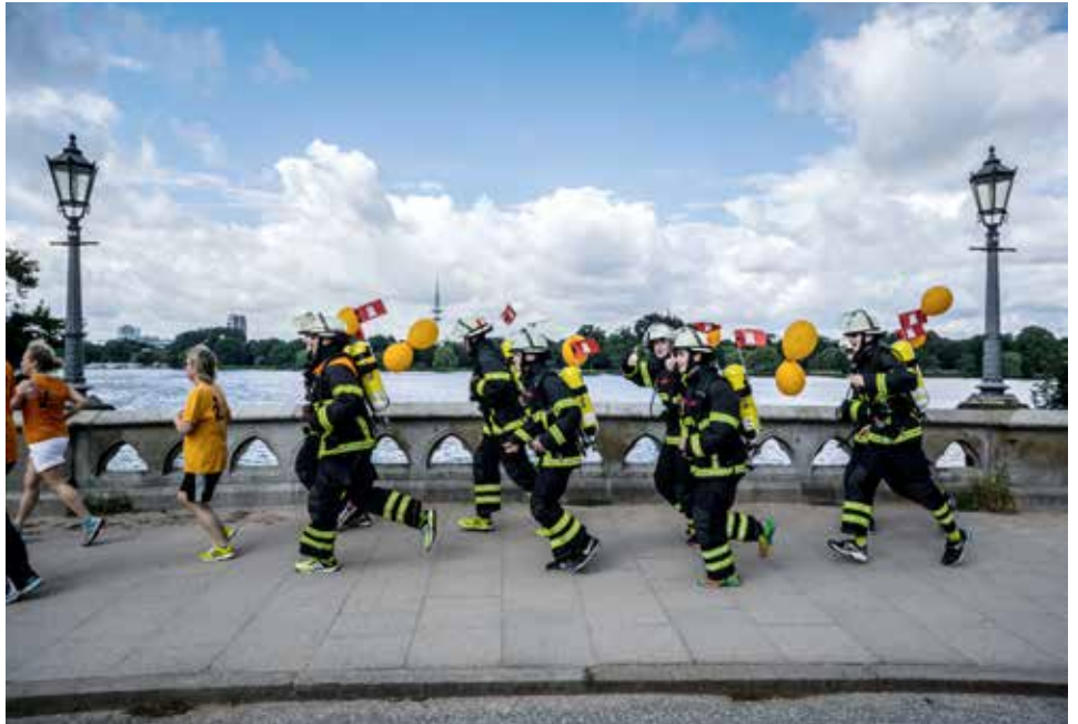
„Laufend gegen Gewalt“ – Durchhalten für den guten Zweck

Beim ersten konnten wir uns darüber hinaus für einen guten Zweck stark machen. Am 3. Juli fand der 9. Benefizlauf „Laufend gegen Gewalt 2016“ statt, der ein deutliches öffentliches Statement gegen die Gewalt an Frauen und Kindern ist. Insgesamt 350 Läuferinnen und Läufer bewältigten die Gesamtstrecke von 7,5 km um die Außenalster – acht davon stellte die Freiwillige Feuerwehr Pöseldorf. Bei angenehmen Temperaturen bahnten wir uns, mit der PSA und dem PA am Rücken, den Weg um die Alster. Nach knapp 58 Minuten hatten wir mit einem Zusatzgewicht von rund 25 kg das Ziel erreicht – eine wirklich anstrengende Demonstration gegen Gewalt. Aber: die Tortur hat sich gelohnt, denn die Begeisterung bei den Zuschauern war enorm. Die nächste Herausforderung bestanden wir beim Skyline-