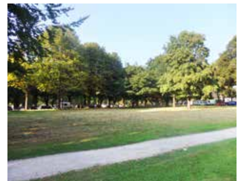
Betroffene Fläche – ein Teilstück der Moorweide

Als angemessene Reaktion auf diese Situation kündigte man an, in einem ersten Schritt in dieser Saison den Standard der Mähfrequenzen einzelner Flächen in den Grün- und Erholungsanlagen auf ein bis zwei Mal im Jahr zu reduzieren. Diese Flächen stehen dann nur noch eingeschränkt der gewohnten Freizeit-