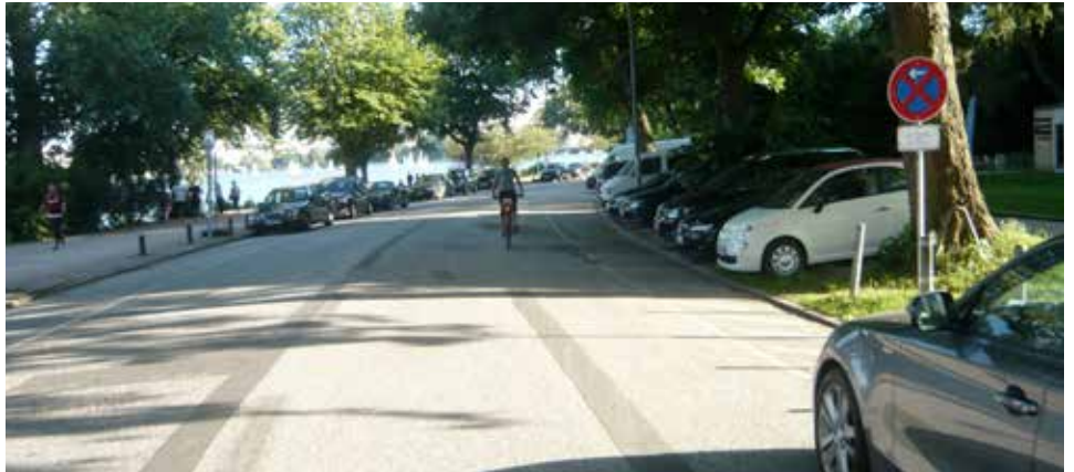
Sorgt für Diskussionsstoff: die Fahrradstraße Alsterufer

Im vollbesetzten Saal der Musikhochschule stellte die Behörde für Wirtschaft, Verkehr und Innovation (BWVI) im Juli ihr vorläufiges Konzept zur Verlängerung der Fahrradstraße am Harvestehuder Weg vor. Der zweite Teilabschnitt von der Alten Rabenstraße bis zum Ende der Straße "Alsterufer" ist noch in der Planungsphase. Der 2-Millionen-Umbau soll 2017 beginnen, sobald das US-Generalkonsulat in die Hafencity gezogen ist. Die derzeitige Durchgangssperre vor dem Konsulat wird nur für Radfahrer geöffnet, eine neue Sperre für Autofahrer auf der Höhe der Fontenay angebracht. Von dort aus werden stadteinwärts fahrende Autos rechts über die Fontenay und stadtauswärts über eine 180-Grad-Kurve auf eine bereits bestehende Nebenfahrbahn zurück auf das Alsterufer geführt.