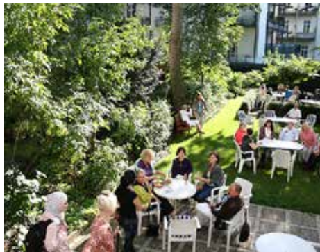
Bei schönem Wetter: Unterricht im Garten

„Der Zweck des Vereins ist die Förderung und Vermittlung fremder Sprachen und fremder Länder sowie die Pflege der menschlichen Beziehungen zwischen den Angehörigen“, so steht es in der Satzung des 1949 gegründeten Sprachenclubs „pro linguis“ und ist heute aktueller denn je. Und so starten auch in diesem Herbst wieder zahlreiche Sprachkurse an der Rothenbaumchaussee 97. Im September beginnen neue Anfängerkurse für Chinesisch, Englisch, Französisch, Japanisch, Portugiesisch, Russisch und Spanisch. Mit der Gasthörerkarte“ können Interessierte die Kurse dreimal besuchen, bevor sie eine Entschei-